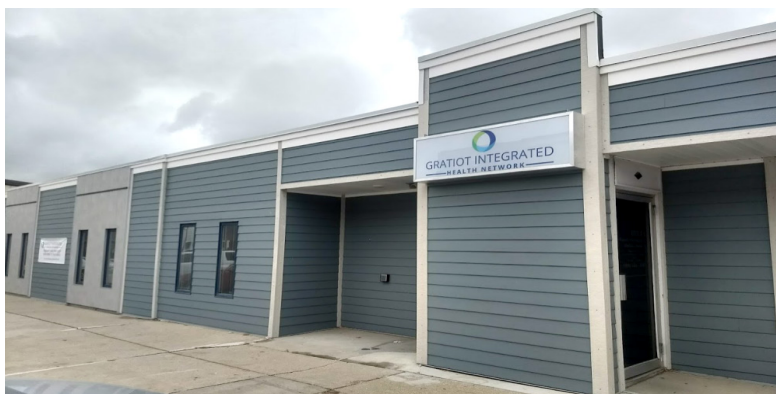
Clínica de Salud Integrada, 224 North Mill Street, St. Louis MI. 48880