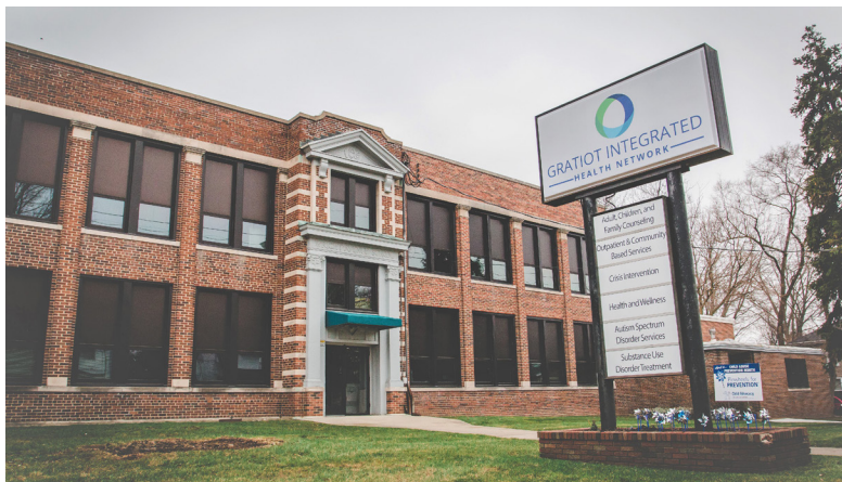
Oficina principal, 608 Wright Avenue, Alma, MI. 48801